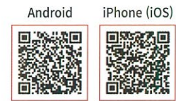
* Electronic billing