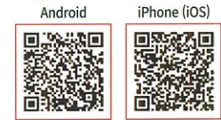
Электрон биллинг эришимли